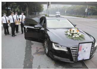
把小狗灵柩抬上車

8月29日，一辆车头挂有小狗遗照的百万豪车沿上海街头一路开过，吸引了众多市民关注。原来，这是在为一只宠物小狗举办隆重葬礼。