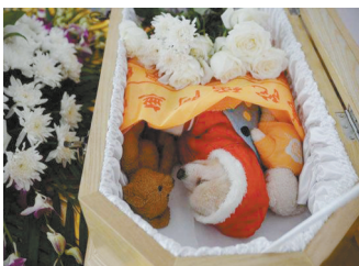
狗狗和几只玩具静静地躺在迷你棺材中