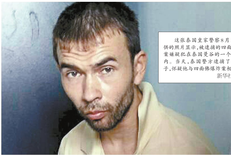
这张泰国皇家警察8月29日提供的照片显示,被逮捕的四面佛爆炸案嫌疑犯在泰国曼谷的一个警察局内。当天,泰国警方逮捕了一名男子,怀疑他与四面佛爆炸案相关。

据新华社曼谷8月29日电(记者李颖 陈家宝 李芒芒)泰国警察总长颂育29日晚对媒体表示,警方将进一步审讯和调查当