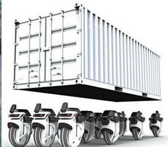
单个Transwheel可运送小包裹,两个组合可运送较大包裹,而若干组合就能够运送大包裹了,甚至可以代替大型集装箱货车。(每邮)