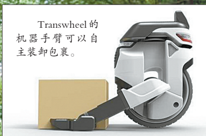
Transwheel的机器手臂可以自主装卸包裹。