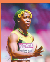
弗雷泽·普莱斯 牙买加 女子100米

虽然人们的目光都集中到了男子100米跑的赛道上,但8月24日女子100米跑也同样精彩纷呈。2008年北京奥运会和2012年伦敦奥运会冠军、牙买加名将弗雷泽·普莱斯卫冕该项目冠军。