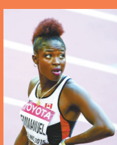
克里斯托·艾曼纽 加拿大 女子100米

在百米女飞人大战中,并不是只有弗拉泽·普莱斯引人注目。她的同胞托德·贾丝明的“泡面头”、特立尼达和多巴哥选手艾耶·米歇尔·李粗壮的红色“麻花辫”都让人印象深刻。而加拿大姑娘克里斯托·艾曼纽是其中最抢眼的一个,她留了一个标准的莫西干头。