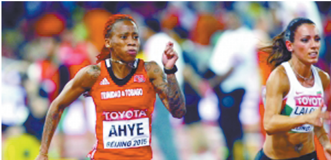
运动员在向终点冲刺

近日,全世界最著名的田径选手都聚集鸟巢,跑道上有博尔特、加特林等闪电一般的人物,场内还有跳高、铅球等展示更高、更强的项目,所有的这一切都让人目不暇接并心潮澎湃。在感受这些激情的同时,选手们也在用各自的方式表达他们对所从事项目的热爱,例如在头顶上做些令人眼花缭乱的文章。