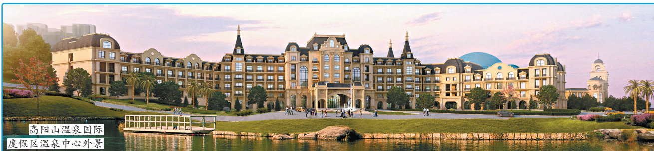
高阳山温泉国际 度假区温泉中心外景