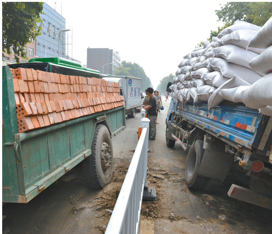
两辆车因陷入回填用料有问题的路沟而倾斜。

记者昨天下午重回现场看到,该路沟已经重新回填,路面通行基本不受影响。蔡丙申称,昨天上午10点,路沟已回填完毕,基本恢复通行能力。