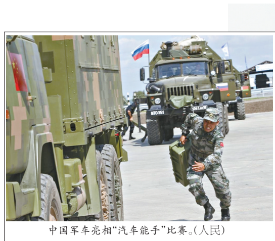
中国军车亮相“汽车能手”比赛。(人民)