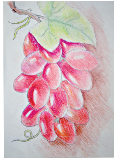
葡萄 李奕瑜 作

从那以后,我知道父母是我最爱的人,我会尽心守护他们。我的心里带着对未来的憧憬以及小小的幸福,眼里却有什么东西在闪闪发光。