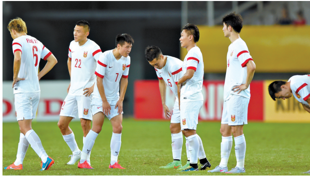
8月2日，中国队球员在比赛后。当日，在湖北武汉进行的2015年东亚杯足球赛中，中国队以0:2不敌韩国队。

说实话，其他数据同样触目惊心。控球率：国足44%，韩国56%；传球数：国足437，韩国607；传球成功率：国足79%，韩国86%。是的，从数据就可以看出，国足全场都处于被动的态势，传球数比对手少了近200次，成功率比对手少了7个百分点。