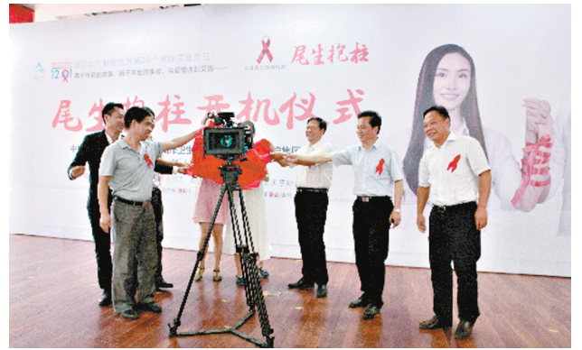
图为开机仪式现场。

据介绍,这是一部关于艾滋病题材的公益电影,电影中涉及的人物和故事都来源于现实生活,出品方希望通过公益宣传活动,让更多人了解艾滋病,掌握其预防知识,共同为艾滋病的防治创造良好的社会环境。