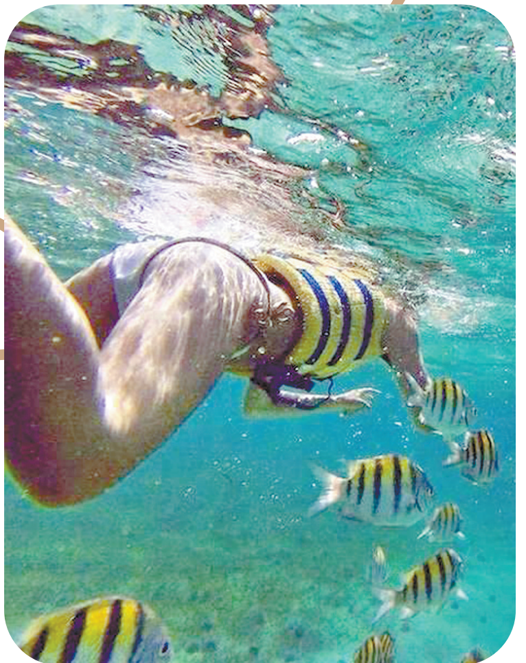
来潜水竟然与小鱼撞衫了!

来照请传到此邮箱: 1725945492@qq.com。照片要清晰,时效性越强越好。还要注明拍摄时间、地点以及您的通信地址。