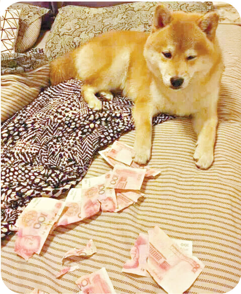
下个月我没法养你了……