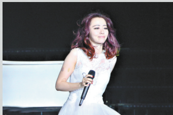
←张靓颖受伤后返台,胳膊上有明显的瘀青

本报讯 8月1日,张靓颖在北京万事达中心举行演唱会,开场后现场气氛热烈。不料张靓颖在演唱会开场第三首歌时从舞台上摔下,当时现场歌唱忽然中断。张靓颖休整后重返舞台,并在台上道歉。昨天凌晨,张靓颖微博发文表示自己没有问题并感谢大家。