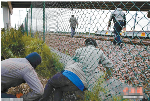
圖為偷渡者鑽過柵欄，進入鐵道。最近幾天，海底隧道法國一端加來港，聚集的偷渡者人數約有4000人。這些偷渡者主要來自厄立特里亞、埃塞俄比亞、蘇丹和阿富汗。 中新

本報訊 最近幾天，約有4000名聚集在法國北部港口城市加來的非法移民硬闖英吉利海峽海底隧道，試圖藏身貨車偷渡至英國，形成聲勢浩大的偷渡潮。英國首相卡梅倫7月30日撻狠話說，英國不是避難天堂，非法移民即使僥倖偷渡成功，將來也會被驅逐出境。