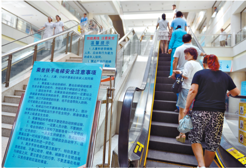
平煤神马医疗集团总医院大厅内的手扶电梯前设置了多块乘坐安全注意说明