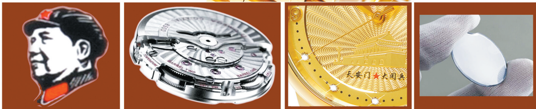
彩金毛泽东立体头像 原装进口全自动机械机芯 十颗天然真钻 蓝宝石耐磨耐划表镜