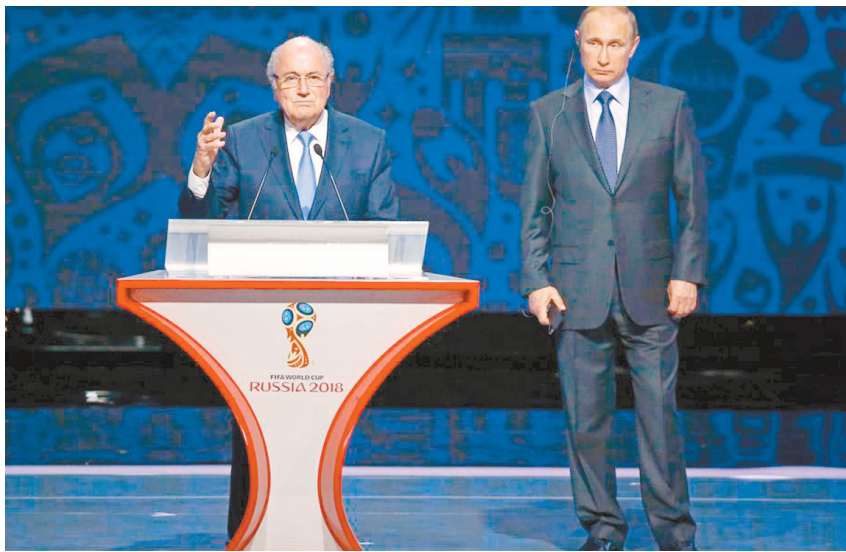
7月25日，俄罗斯总统普京(右)与国际足联主席布拉特在抽签仪式上。

对于国足而言，如果获得亚洲区第五，对阵这些中北美球队时，国足的历史战绩并不完全处于下风。2001年，中国队曾3:0战胜特立尼达和多巴哥队，2011年中国队曾在热身赛中1:0战胜牙买加队，今年3月则2:2战平海地队。