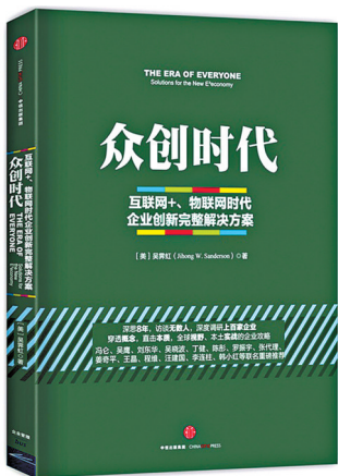
《众创时代：互联网+、物联网时代企业创新完整解决方案》 吴昊虹著 中信出版社

全球最大的出租车公司Uber没有一辆出租车；全球最大的住宿服务提供商Airbnb没有一个房间和旅行项目，但他们无一例外地创造了一个举世闻名的超级轻资产公司，这背后究竟说明了什么？《众创时代：互联网+、物联网时代企业创新完整解决方案》中，将依托于“C2C商业生态圈模式”，解析这些企业成功的法则，并以此为基础，为传统企业的转型也提供了一套全新的解决方案。