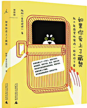
《如果你爱上了藏獒，就不能指望他像鸡一样给你下蛋》 陈彤著 广西师范大学出版社