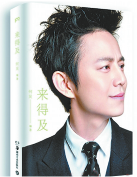
《来得及》 何炅著 浦睿文化出版

在书中，何炅讲述了他一路走来的成长故事和人生感悟，首度坦露他关于青春的回忆以及那些埋藏在内心的青春秘密。