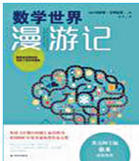
《数学世界漫游记》 作者：(英国)艾利克斯·贝洛斯 译者：孟天 译林出版社

本书作者是牛津大学数学和哲学硕士、资深记者，他对数学感到好奇的人们写了这本通俗有趣的“数学大百科”。作者通过观察身边的数学现象、走访世界各地的数学家及数学研究机构，串联起一个个基础数学概念、经典数学实验、实用数学案例以及趣味数学游戏，从小学水平的数学问题到高等数学的经典命题，无所不包。全书寓教于乐，让读者不知不觉跨越数学世界“高冷”的藩篱，发现数学的趣味性和实用性。