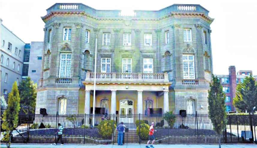
古巴驻华盛顿利益代表处的工作人员正在进行升级大使馆的准备工作