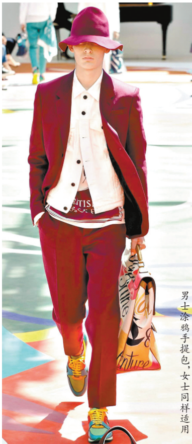
男士涂鸦手提包，女士同样适用

在2015春夏男装周上，就出现了不少让女人也想拥有的手袋，像是动物纹手袋，不管是颜色还是款式都非常讨人喜欢，而涂鸦手提袋看起来同样个性十足，瞬间秒杀了一众男女粉丝的心。此外，像男士的托特包则可以充当女士短期出游的旅行手提袋，看起来既时髦，又实用。或许在不久的将来，男士手袋女士用将成为一种风潮。其实无论是男款还是女款，只要用起来舒适方便，同时还能凹造型的就是好包。