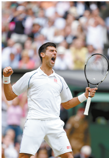
德约科维奇如今是网坛“一哥”。新华社发

当纳达尔状态陷入低谷、费德勒难挡岁月流逝的无情,而穆雷与四巨头的另外三人还有些距离时,温网后继续在ATP世界排名领跑的小德,无疑已经将风头独揽。(李远飞)