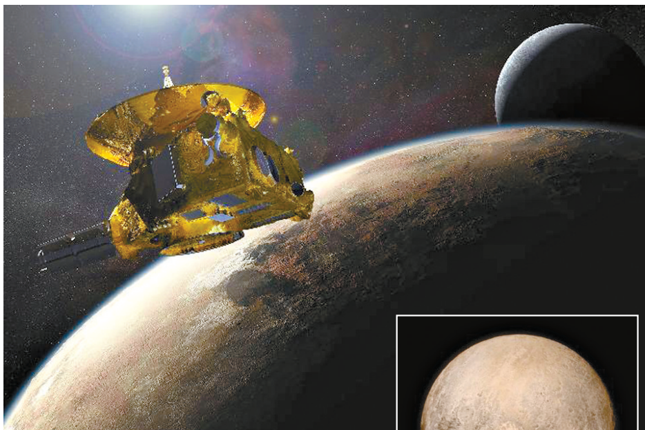
上图这是美国宇航局2015年7月提供的“新视野”号探测器与冥王星及其卫星“会面”的设想图。

冥王星于1930年首次进入人类视野,曾被当作太阳系第九大行星。但国际天文学联合会于2006年对大行星重新定义,冥王星“惨遭降级”为矮行星。