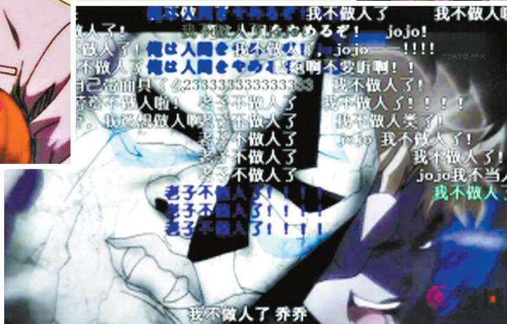
动漫高端速成法——看弹幕最多的部分