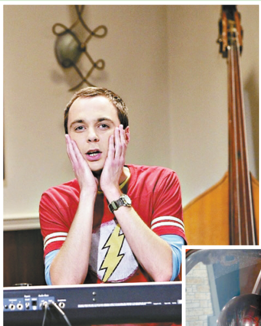
美剧《生活大爆炸》中的“谢耳朵”