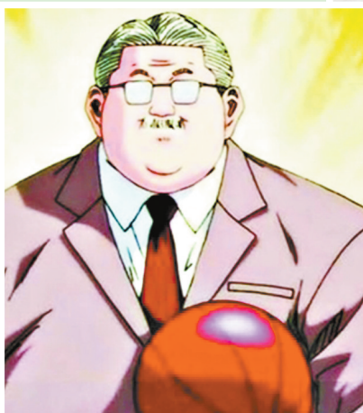
看《灌篮高手》学习如何评论篮球