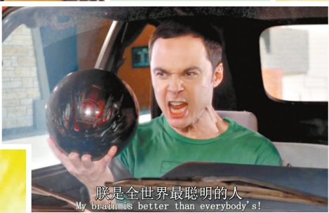
朕是全世界最聪明的人 My brain is better than everybody's!