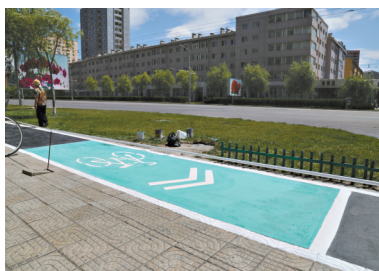
这是7月9日在朝鲜平壤街头拍摄的新设立的自行车专用道。