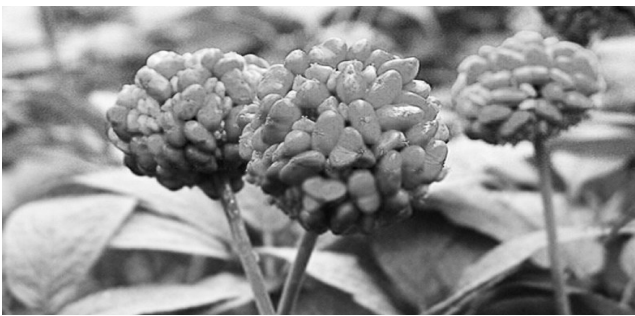
文山三七品质纯 地地道道原生态

为确保品质,降低价格,文山三七健康采购团亲赴云南文山,到三七种植区实地考察,请专家对三七品质现场鉴定,直接与种植户签订供货协议。