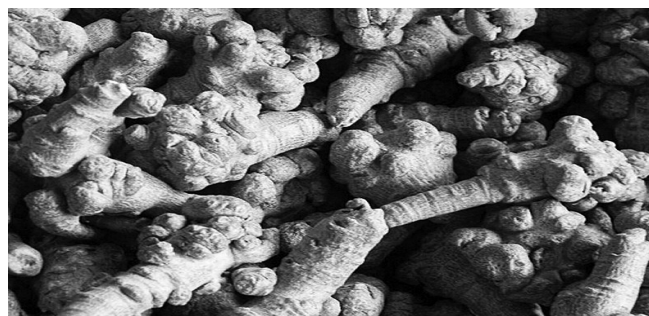
文山三七功效多 每天一勺三七身体好

文山三七健康采购团与原产地主流媒体联合质保,精选文山三七,不打磨,不打蜡,吃了放心。