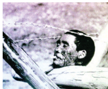
日军恶作剧地在被杀害的中国人头颅嘴里插入一支香烟(照片)。

昨天，中国人民抗日战争纪念馆举办的《伟大胜利 历史贡献——纪念中国人民抗日战争暨世界反法西斯战争胜利70周年主题展览》开幕，今起正式对公众开放，多份重要文物首次被展出，在冰冷的展台上无声地记录着那段被鲜血染红的历史。