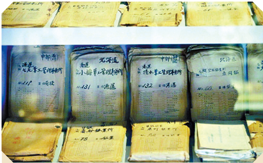
被强掳赴日劳工的姓名、契约书、死亡诊断书等内容

昨天，中国人民抗日战争纪念馆举办的《伟大胜利 历史贡献——纪念中国人民抗日战争暨世界反法西斯战争胜利70周年主题展览》开幕，今起正式对公众开放，多份重要文物首次被展出，在冰冷的展台上无声地记录着那段被鲜血染红的历史。