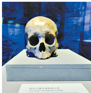
首次展出的南京大屠杀遇难者头骨