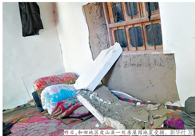
昨日,和田地区皮山县一处房屋因地震受损。