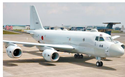
日本海上自卫队在神奈川县厚木基地展示了1架P-1反潜巡逻机