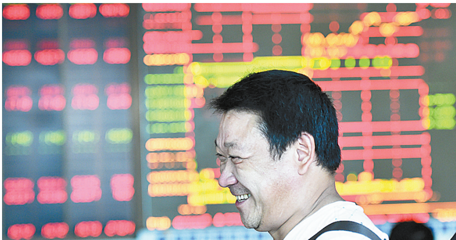
昨日,股民在海口一证券营业部里关注股市行情。