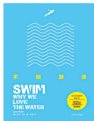
《不如游泳》 作者：【美国】琳恩·雪儿 译者：叶盛 上海译文出版社

作者记述了自己多次参加野外游泳赛事的经历，探寻了人们要游泳的原因，回望了历史上游泳方式的变迁和游泳对于我们生活的影响，以及这项古老运动如何从个人行为演变为社交活动。本书巧妙融合了自传、文化史、运动心理学和旅游札记汇集了与游泳相关的趣闻轶事，文笔轻松有趣。