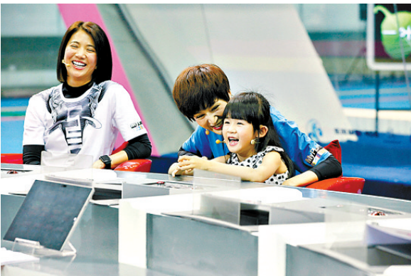
贝儿和杨阳洋各自为爹妈加油