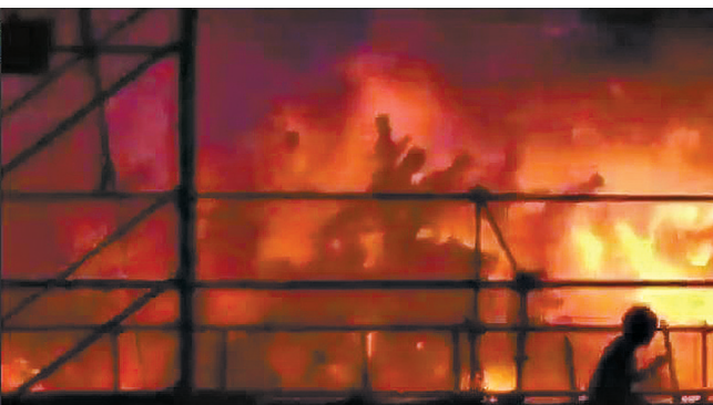
6月27日在新北市八仙乐园,游客手机拍摄的粉尘爆炸现场。