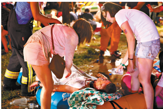
6月27日,在新北市八仙乐园,未受伤的民众照顾受伤游客。

6月27日晚那晚的爆炸,是新北市救灾史上受伤人数最多的意外。对许多人来说,这一晚的意外,带来的或许是一生的伤痛。(新华)