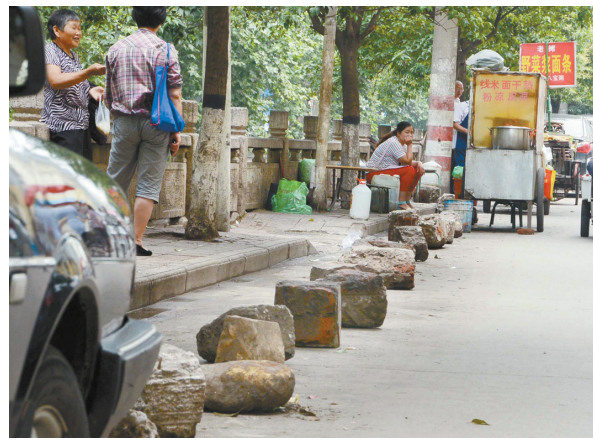
昨天上午,市区朝阳路北段的“巨石阵”。

“都是有孩子的人,只要孩子没事就行。”张红阳说,他没想到会有人将他救人的事拍下,并发到平顶山微报上。