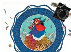
北京的 39 所“野鸡大学”