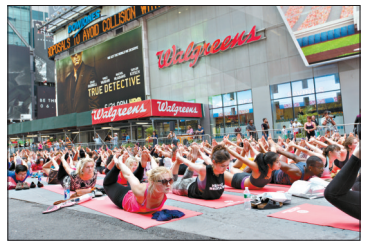
6月21日,瑜伽爱好者在美国纽约时报广场练习瑜伽。当天是“国际瑜伽日”,来自美国和世界各国的众多瑜伽爱好者在纽约时报广场进行瑜伽表演,迎接夏至到来。纽约时报广场联盟连续主办了13届瑜伽迎夏至活动。