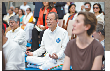
6月21日,在联合国总部,联合国秘书长潘基文在体验瑜伽。当天,联合国总部举行庆祝活动庆祝首个国际瑜伽日。