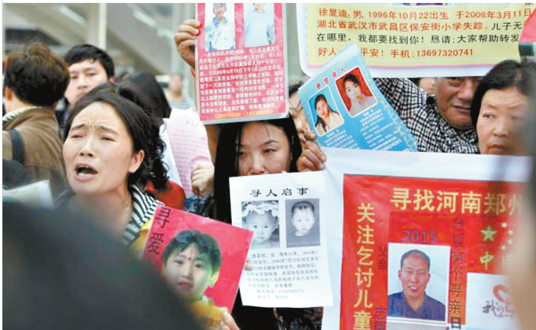
2015年4月，河南郑州，河南省首届“寻亲大会”在郑州二七广场举行，被拐孩子的家长展示孩子的照片。资料图

近两日，朋友圈突然被广大网友刷屏：“建议国家改变有关贩卖儿童的法律条款，拐卖儿童判死刑！买孩子的判无期！”相关话题引起了社会各界的广泛关注和热烈争议，大量网民在微博、微信朋友圈等社交平台表态支持一律死刑，法学界、社会学界则多从专业角度提出反对意见。事实上，拐卖妇女儿童情节严重的罪犯被判死刑，在我国不是没有先例；至于“是否该一律判死刑”，则成为争论的焦点所在。