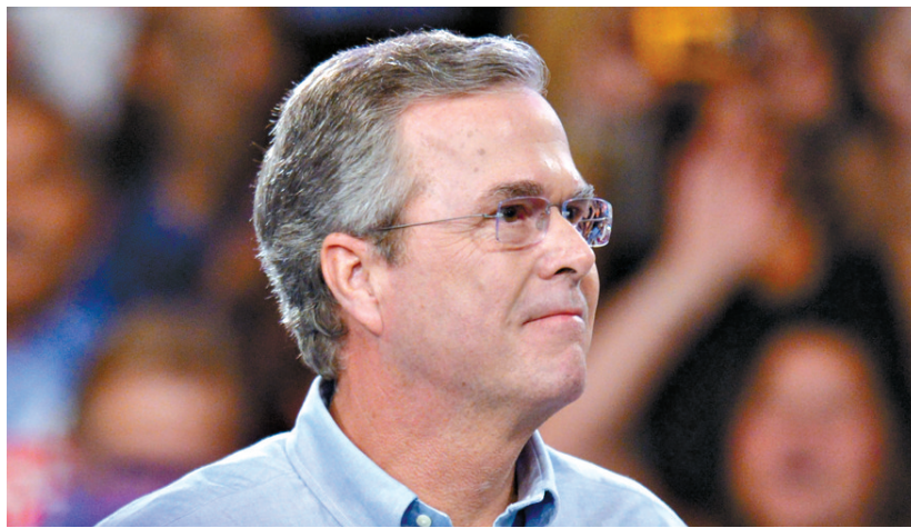
6月15日,在美国迈阿密,佛罗里达州前州长杰布·布什出席活动,正式宣布参加2016年美国大选。