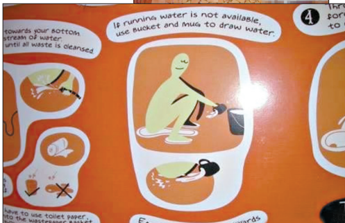
左图为网友拍摄的印度室内厕所场景及冲洗设备使用图示。

另外,自今年7月1日起,澳大利亚 Melbourne Institute of Business and Technology(墨尔本商业技术学院)将正式更名为 Deakin College,即迪肯大学学院。(金羊)