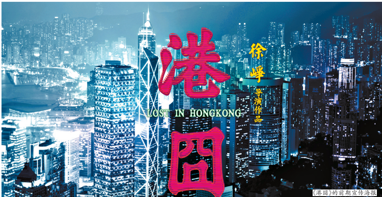
《港囧》的前期宣传海报