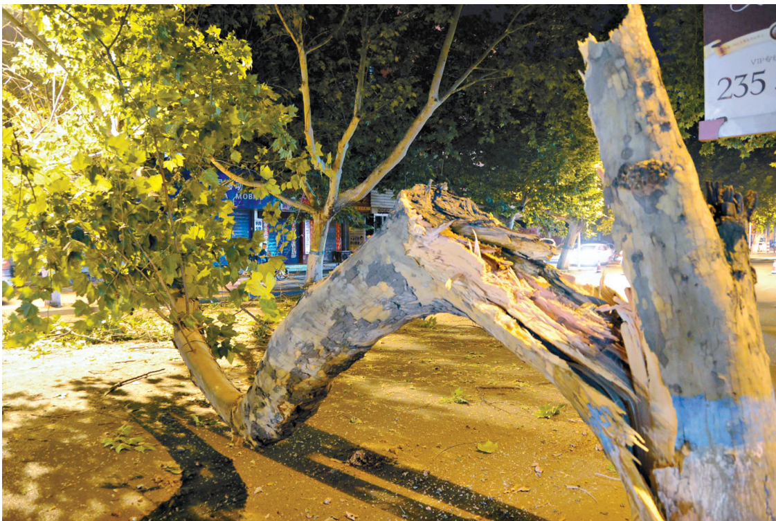
直径约半米的法桐树干断裂倒向光明路快车道。