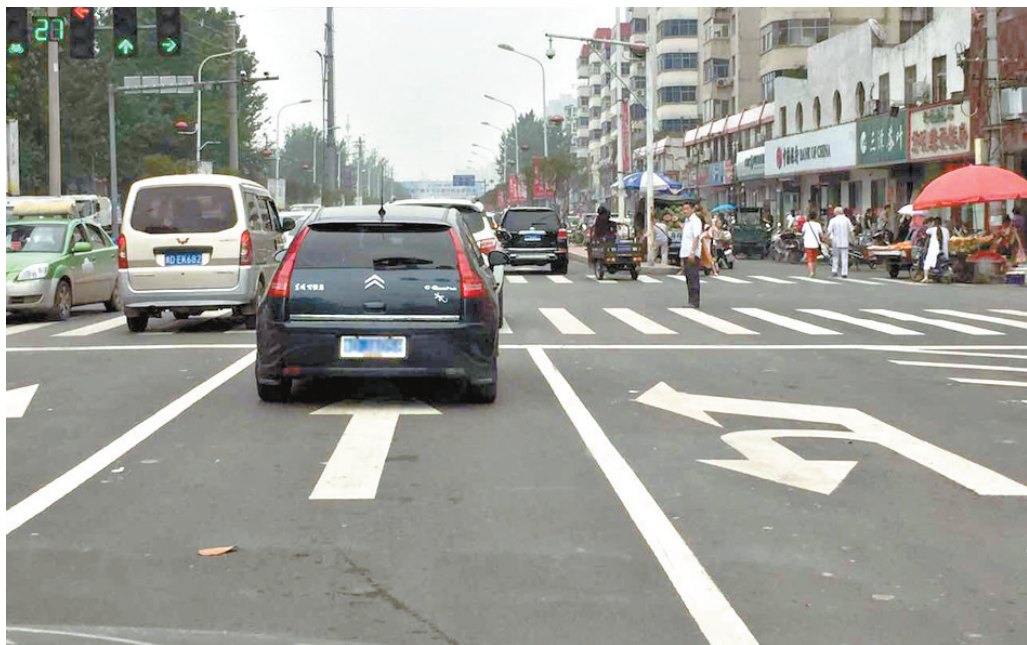
新华路与东风路交叉口