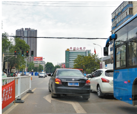
湛南路与开源路交叉口