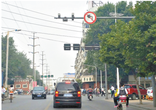
湛北路与开源路交叉口