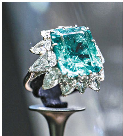
祖母绿钻石铂金戒指(约创作于1962年)