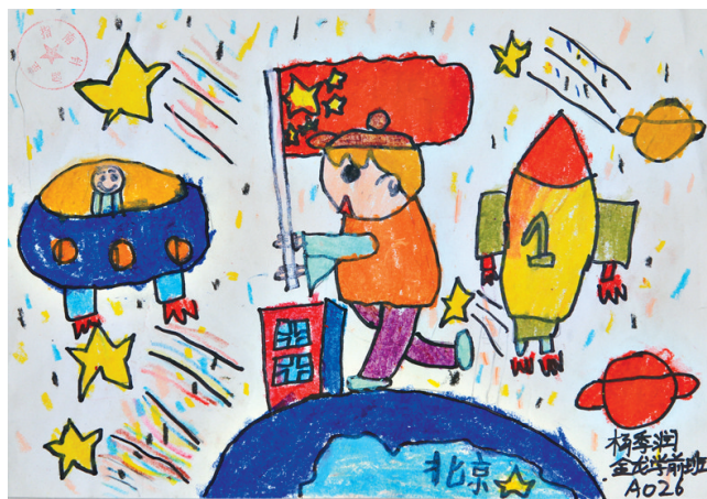
杨季润 金龙学前班 A026