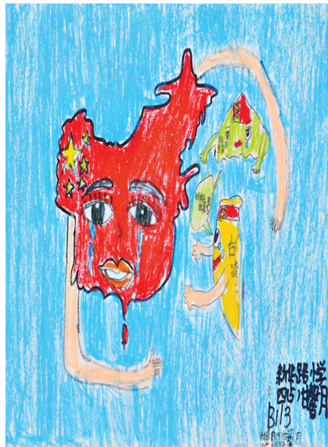
甘馨月 新华路小学 B113