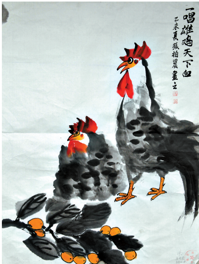
张柏晨 韦伦双语学校 B192