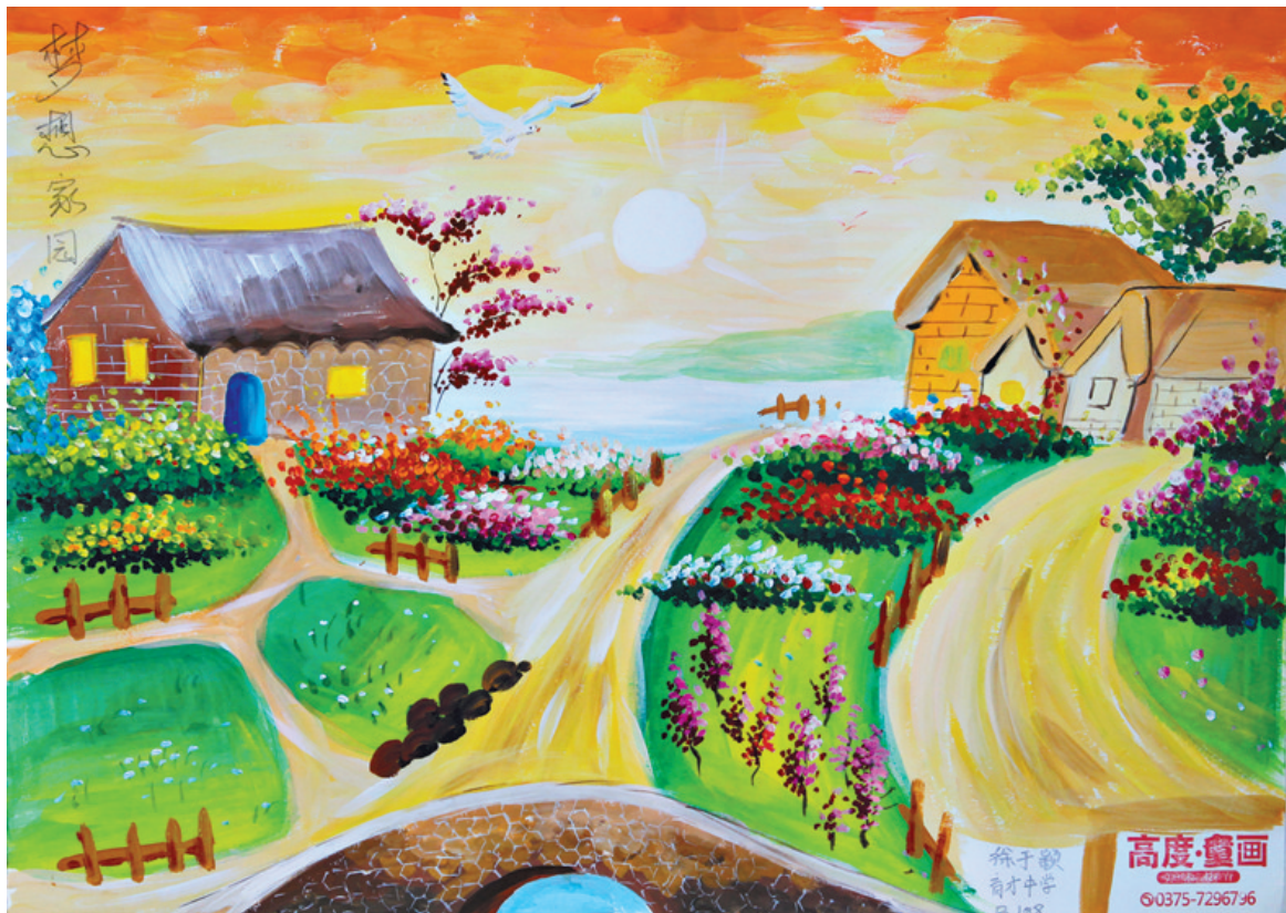
徐于颖 育才中学 B188

本次绘画大赛得到指南针童心画美术馆和高度童画少儿美术培训基地的大力支持，在此表示感谢。 指南针童心画美术馆地址：建设路与开源路交叉口北100米路西广源宾馆4楼。电话：2980375。 高度童画少儿美术培训基地地址：建设路与中兴路交叉口南20米如家宾馆负一层。电话：7296796。