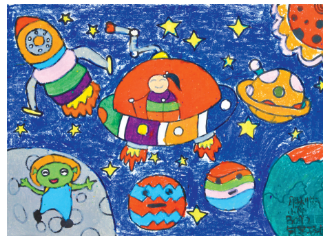
何昱璇 胜利街小学 B092