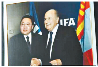
布拉特与蒙古国总统

女足世界杯举办到第七届，已经扩大到了24支球队。泰国、瑞士、西班牙、喀麦隆、哥斯达黎加、科特迪瓦、荷兰、厄瓜多尔8支女足球队都是历史上首次入围世界杯决赛圈。虽然球队多了，但也有一种声音认为世界杯的观赏性会下降。尤其是小组赛上，当这些新军遭遇美德这样的夺冠豪强时，是否会演变成一场“屠杀”？本届杯赛上新军更多，世界杯经验有限，实力孱弱，为大比分营造出了可能性。8支初登世界杯舞台的新军，将为避免惨败而努力。(刘大伟)