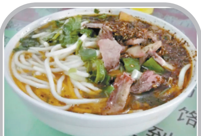
郟县饸饹面配口乐