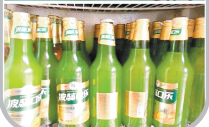
郟县饸饹面配口乐