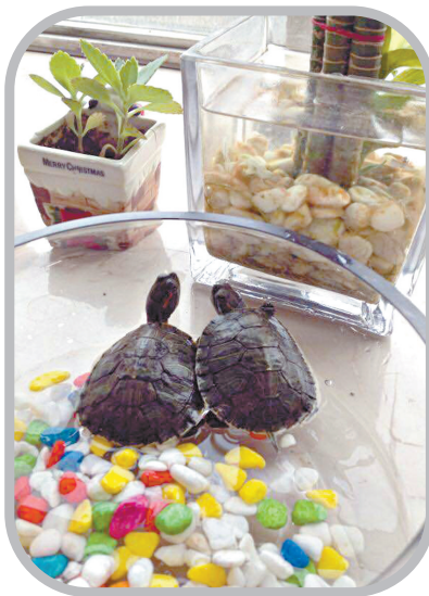
微友“不懂”自己养的两只小乌龟