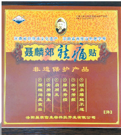
聂麟郊祛痛贴资料图