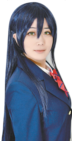
小孔妈妈cos的「海未妈妈」