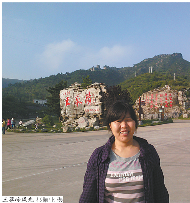
王莽岭风光

华通旅行社报名热线:全国统一电话:4000589800。网址:www.0375pds.net。地址:中兴路南段市客运中心站大厅(2222066)、佳田国际大酒店一楼(2699880)、矿工路市长途汽车站出站口(3902221)、矿工路中段新特药对面亿昇花园1楼东(2903338)、市工人文化宫东门大屏幕向北70米(2860666)、郑州海外国际旅行社有限公司平顶山分社基泰大厦三楼0311室(2122999、2076166)。(刘晓媛)