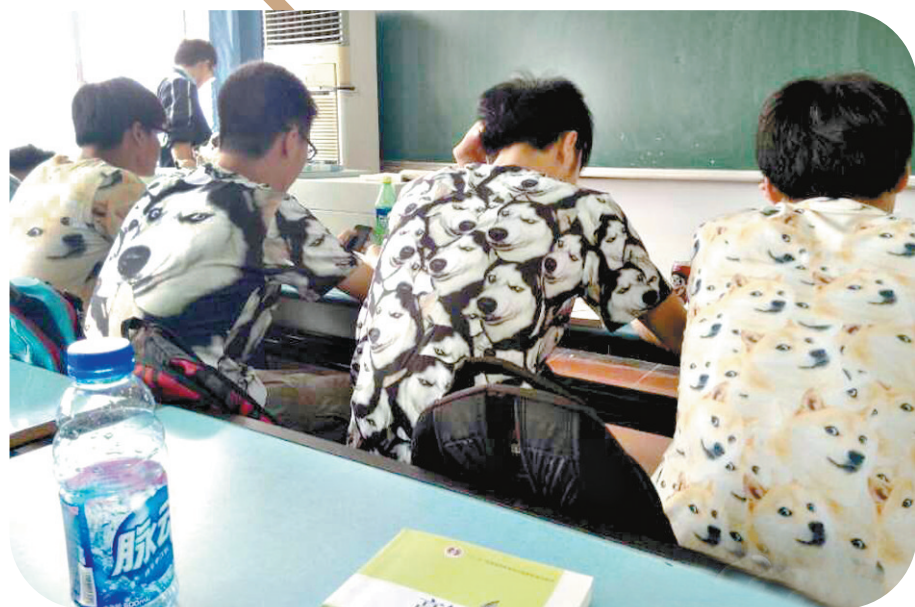
你们考虑过后排同学的感受吗?