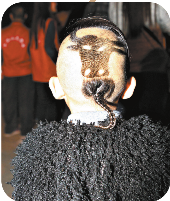
我是“小牛人”