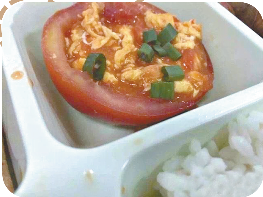
学校食堂的番茄炒蛋,也是醉了