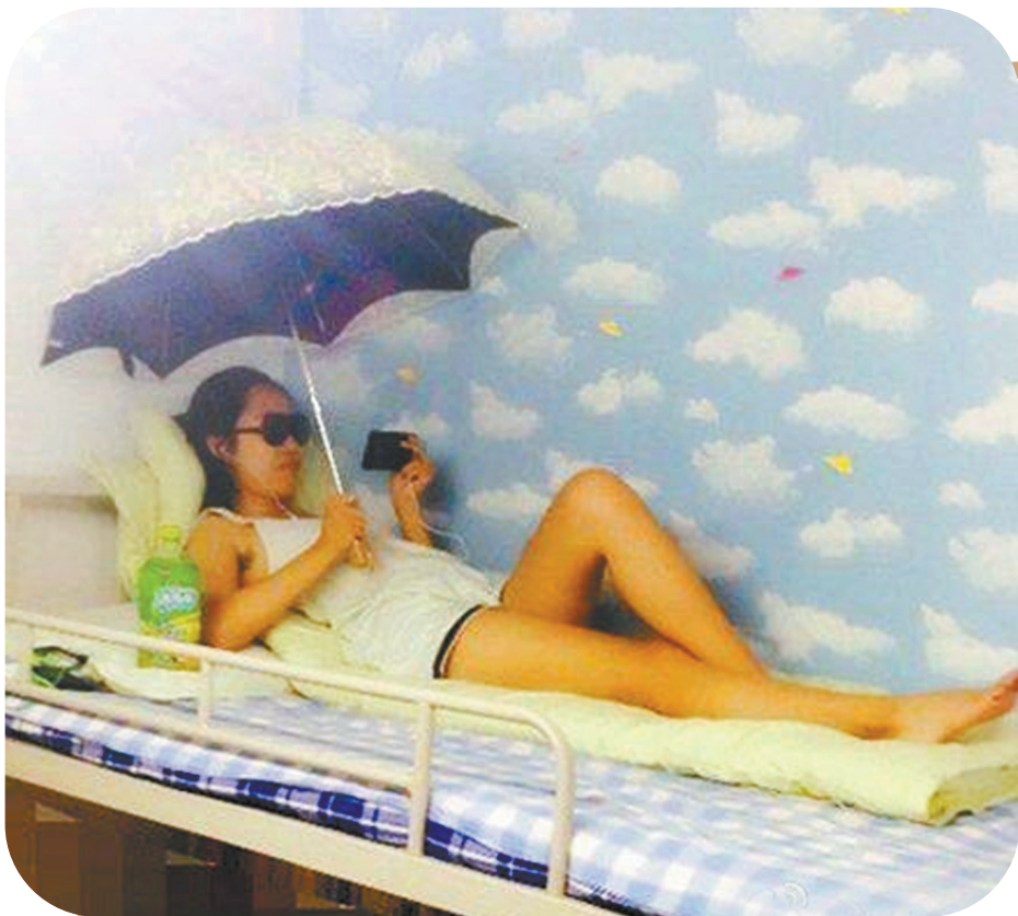
妹纸,你也太有情调了