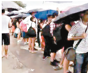
纽约街头市民冒雨排队买拉面汉堡

纽约绝对是一个能创造无限惊喜的地方,只要敢于想象,一切皆有可能发生。美食也不例外,世界各地的美味在这个国际大都市都能占有一席之地,而且它们相互借鉴、融合,擦出了暧昧的火花。