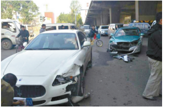
5月9日，出租车撞上玛莎拉蒂，两车均受损